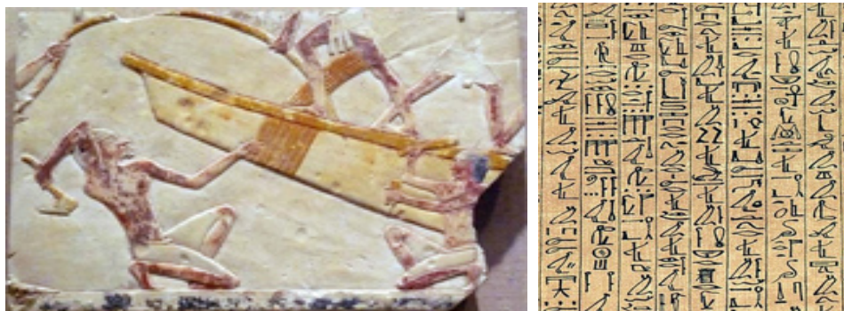
Слева: Произведение искусства иллюстрирует, как египтяне строили лодки. Справа: Иероглифы.

Египтяне, как и шумеры в Месопотамии, постепенно перешли от клинописи к иероглифам . В то время, как в Месопотамии писали на глинянных пластинах, египтяне писали на папирусе.