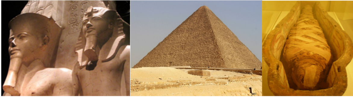
На иллюстрациях: фараоны, пирамида Хеопса и мумия.

Многих фараонов, а также некоторых очень богатых мужчин хоронили в пирамидах. В Египте было построено почти пятьдесят пирамид. Самая большая из них – Хеопская пирамида названна так в честь фараона Хеопса, похороненного в ней. Годы правления фараона Хеопса – приблизительно 2589 – 2566 годы до нашей эры. Эта пирамида находится в пустыне Гиза, недалеко от Каира, теперешней столицы Египта. В Долине царей недалеко от города Луксор были также найдены захоронения царей и мумии.