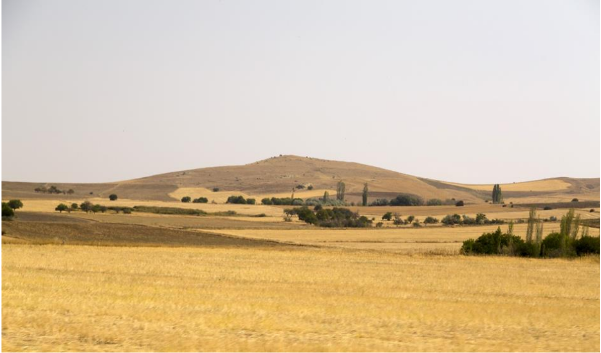
Steppelandskap i Tyrkia