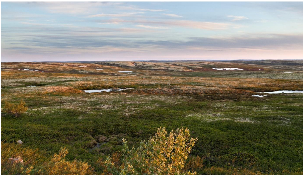
Tundra i Nord-Russland

التندرا هي مناطق واسعة من الصقيع فوق التلال على مدار السنة .فقط الطبقة العليا من الأرض هي التي تذوب في الصيف . لا تنمو الأشجار على التندرا .معظم التندرا موجود في روسيا وكندا وألاسكا .