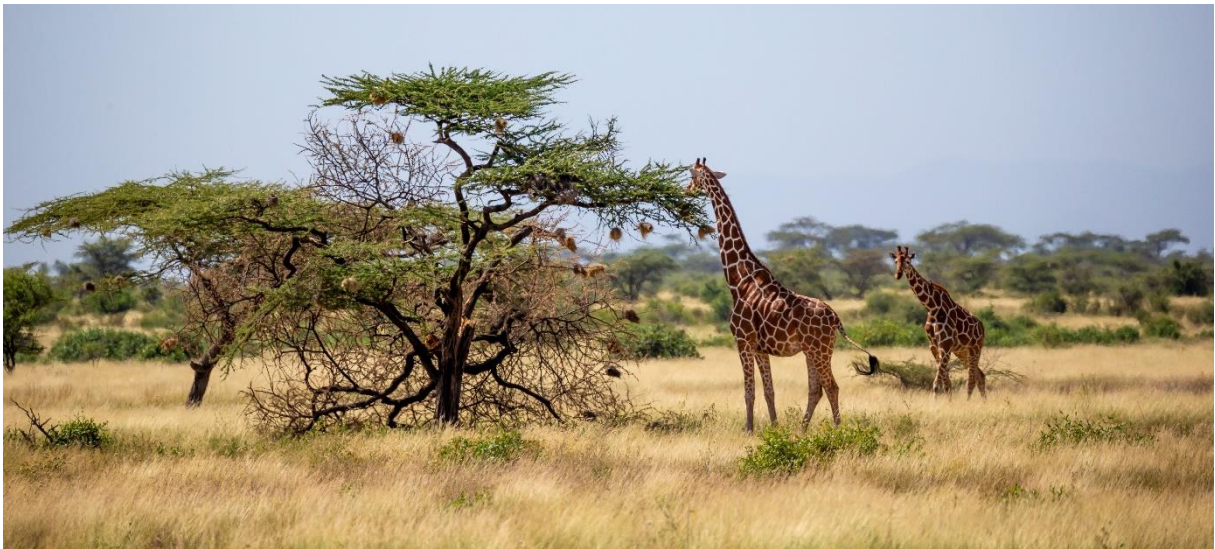
Savanne i Somalia

السافانا هي منطقة من العشب المرتفع والأشجار المتناثرة في المناطق الاستوائية. الكثير من السافانا الكبيرة موجودة في إفريقيا.