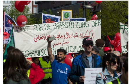
Берлин. Фото: Сергей Коль, Shutterstock Лондон. Фото: Лондисланд, Shutterstock Берлин. Сергей Коль, Shutterstock

Каждый год 1-го мая тысячи рабочих выходят и маршируют по улицам. Этот день является официальным праздником во многих странах. Этот день знаменует длительную борьбу за права, которые мы сейчас принимаем как должное.