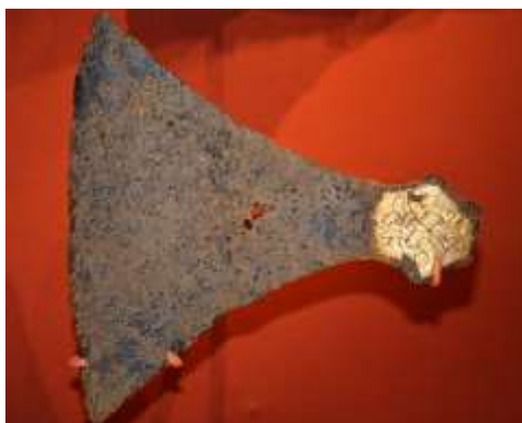
Железный топор с золотым орнаментом , принадлежащий викингам (1000-1050 гг.) найден в Ботхамн, Трумс (Botnhamn i Troms). Property field_image_byline

К середине I тысячелетия до н. э. находки железных предметов известны на крайнем севере Норвегии, к северу от Киркенеса, а также на севере Финляндии и Карелии. Во время железного века в Норвегии появились укрепительные сооружения на холмах. В V-VII веках известны большие каменные валы на возвышенных местах, внутри которых не было строений. Здесь могло укрыться от опасности население целого района и долго обороняться от врагов. Здесь же, вероятно, собирались сходки (тинги) для решения важных вопросов.