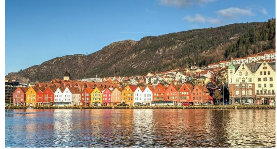
Bryggen i Bergen

يقع أعلى شلال في النرويج في Møre og Romsdal ، ويسمى Vinnufossen. أشهر شلال هو Vøringsfossen ، ويقع في مقاطعة Vestland. لا يوجد الكثير من المياه في أعلى الشلالات في النرويج..