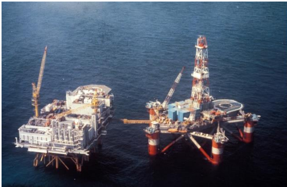
Oljeplattform