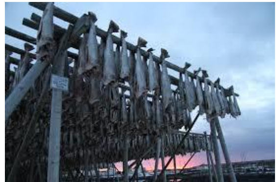
Skrei henger til tørk på hjell.

نوردلاند هي مقاطعة طويلة وضيقة على الحدود مع السويد. مدينة بودو Bodo هي أكبر مدينة في نوردلاند.