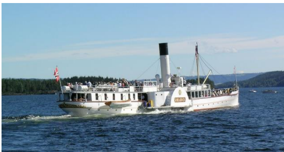
Mahlum, Riksantikvaren Skibladner

المنطقة الداخلية إنلانديت هي المقاطعة الوحيدة التي ليس لديها خط ساحلي. تمتد حدود المقاطعة الى حدود السويد. وتوجد بها أكبر بحيرة في النرويج هي بحيرة ميوسة Mjøsa، تقع في مقاطعة إنلانديت. تشتهر Mjøsa بسفينة Skibladner و هي أقدم سفينة تعمل في النرويج. تبحر Skibladner بين Eidsvoll و Hamar و Lillehammer و Gjøvik.