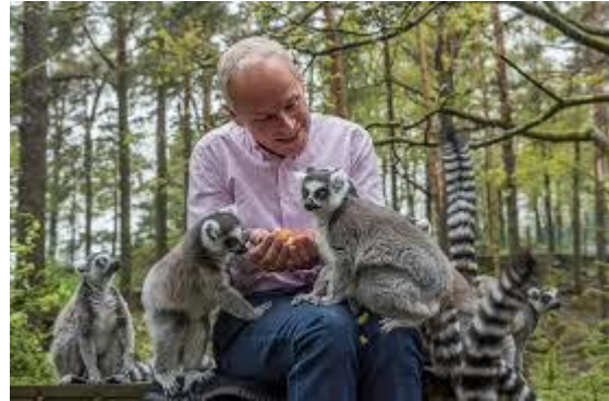
Lemurer i Kristiansand dyrepark.

أكبر مدينة في منطقة الجنوب هي كريستيانساند. تقع أكبر حديقة حيوانات في النرويج في كريستيانساند ، وتسمى حديقة حيوان كريستيانساند ، ولكن غالبًا ما يطلق عليها الناس اسم حديقة الحيوانات.